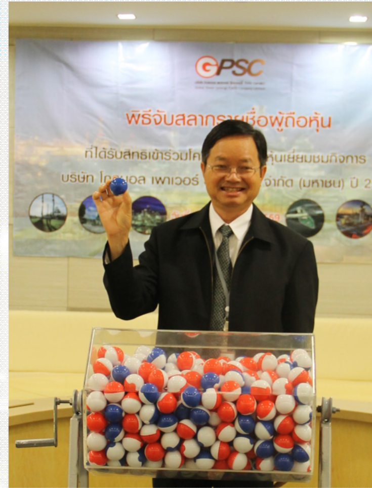
ผู้บริหารร่วมกันจับฉลาก