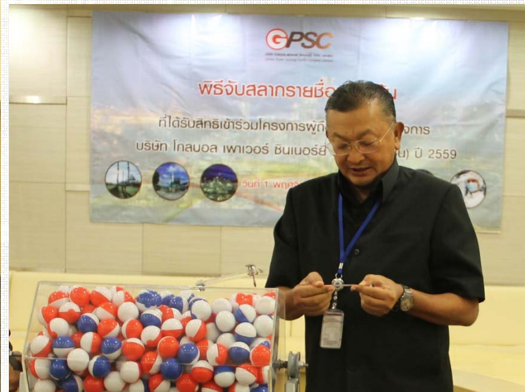
ผู้บริหารร่วมกันจับฉลาก