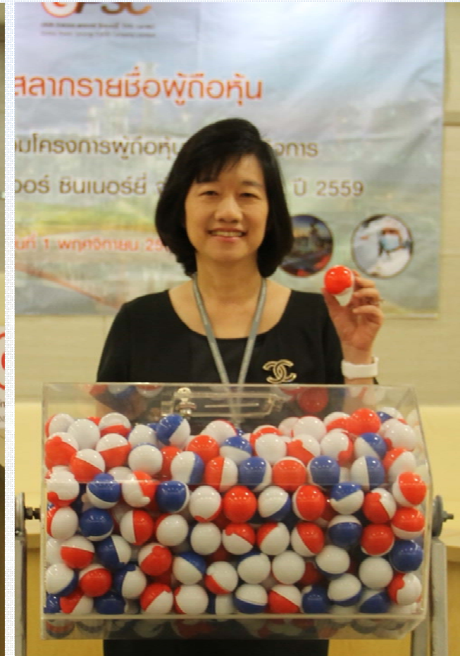
ผู้บริหารร่วมกันจับฉลาก